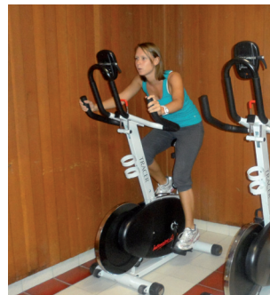
ÉDUCATION PHYSIQUE ADAPTÉE